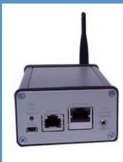
Récepteur avec une antenne